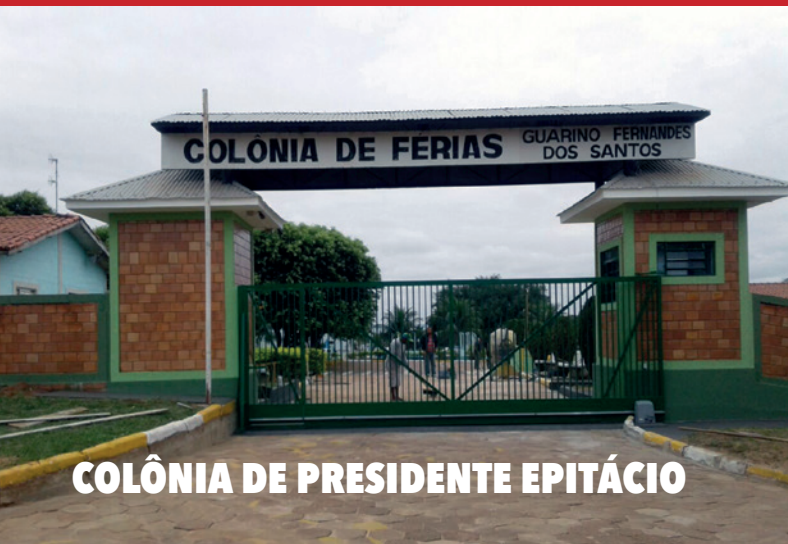
COLÔNIA DE PRESIDENTE EPITÁCIO

SE VOCÊ QUER BELOS DIAS NA PRAIA, A OPÇÃO É VISITAR A COLÔNIA DE FÉRIAS DE SUARÃO, MAS SE PREFERE PESCAR E CURTIR A TRANQUILIDADE DO INTERIOR DO ESTADO É SÓ RESERVAR A COLÔNIA DE FÉRIAS DE PRESIDENTE EPITÁCIO!