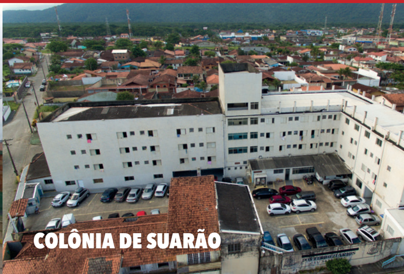
COLÔNIA DE SUARÃO

NAS DUAS UNIDADES, VOCÊ TEM CONFORTO E SEGURANÇA PARA APROVEITAR, AO SEU ESTILO, MOMENTOS INESQUECÍVEIS AO LADO DE QUEM GOSTA!