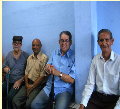
Sorrisos eram facilmente encontrados