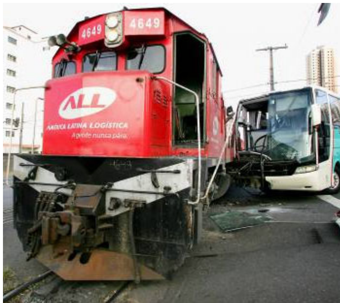
Os acidentes colocam em risco trabalhadores e população

A primeira audiência do processo de monocondução ocorreu como esperado. A empresa usou de recursos protelatórios para atrasar o processo, porém, inicialmente contornáveis.