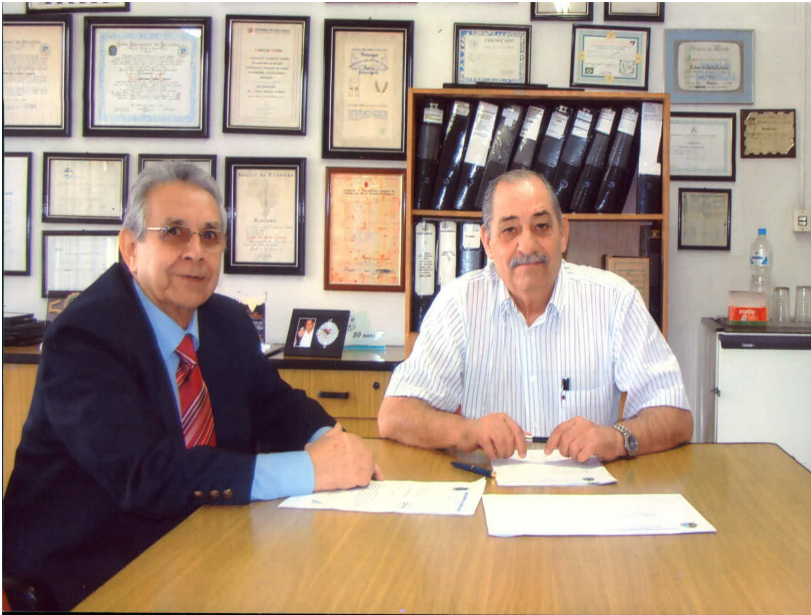
Presidente da Câmara de Laranjal Paulista e Presidente do Sindicato da Sorocabana