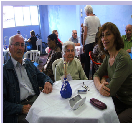
Muitos ferroviários prestigiaram o evento