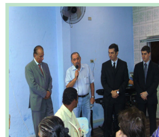
O Presidente do Sindicato também estava presente