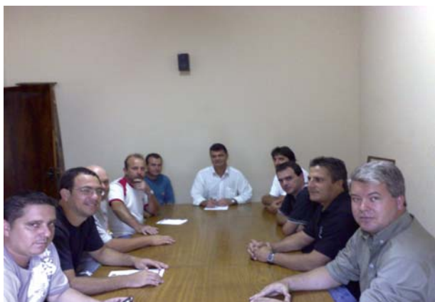
Maquinistas expõe problemas da categoria